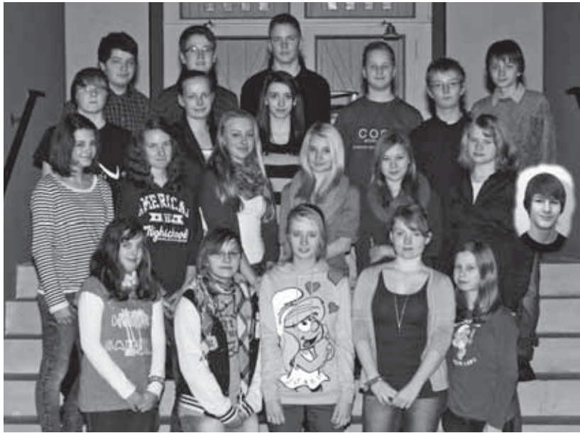
Abendmahlsfeier am Samstag, 13. April 2013, 19 Uhr in der Kilianskirche Konfirmation am Sonntag, 14. April 2013, 10 Uhr in der Kilianskirche