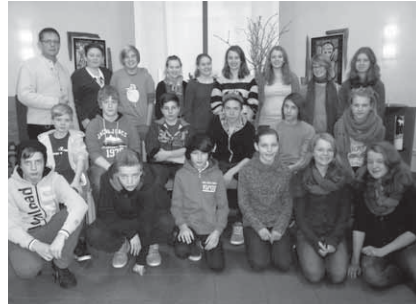
Abendmahls-gottesdienst am Samstag, 20. April, 18.00 Uhr in der Markuskirche Konfirmation am Sonntag, 21. April, 10.00 Uhr in der Markuskirche