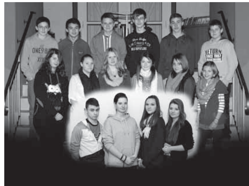
Abendmahlsfeier am Samstag, 13. April 2013, 19 Uhr in der Kilianskirche Konfirmation am Sonntag, 14. April 2013, 10 Uhr in der Kilianskirche