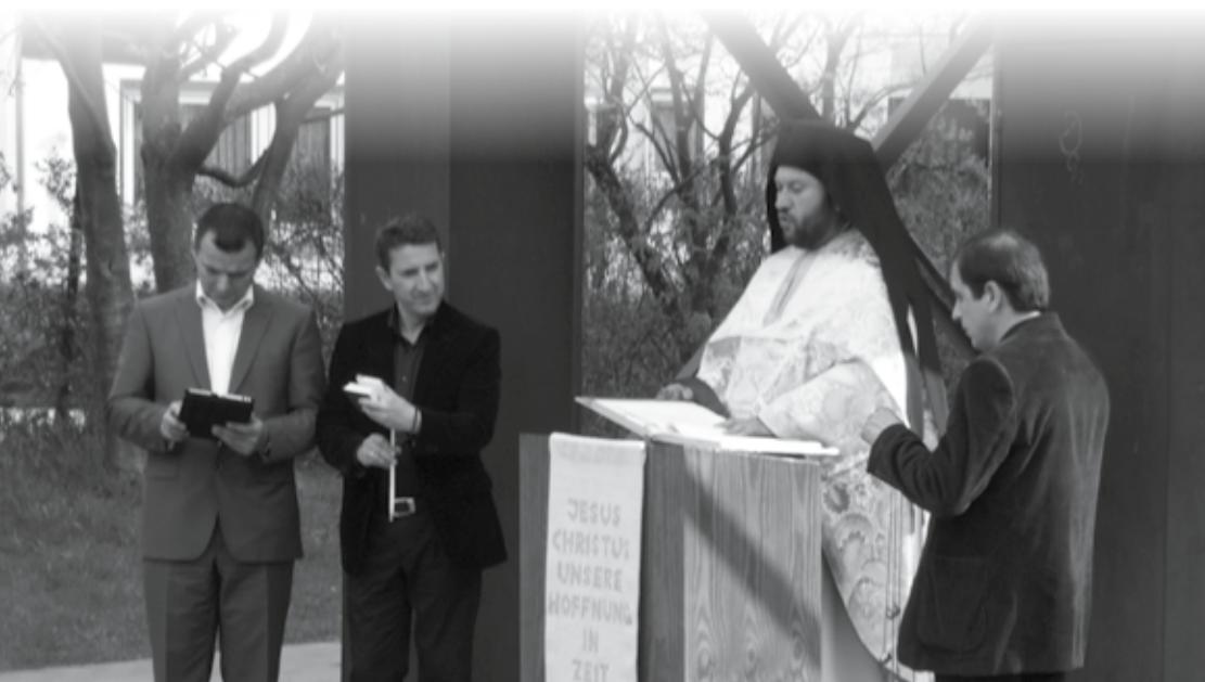
Lesung des Osterevangeliums vom Pult vor dem Glockenturm der Markuskirche aus