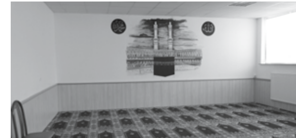
Der eigene Gebetsraum der Frauen

Die heutige Moschee wurde 2008 eingeweiht. Sie ist ein großzügiges Gemeindezentrum mit einem großen Gemeinde- und Konferenzsaal im Erdgeschoss, dazu weiteren Räumen wie Küche, Café und Versammlungsraum, Jugendraum, Unterrichtszimmer und dem eigenen Gebetsraum der Frauen. Im