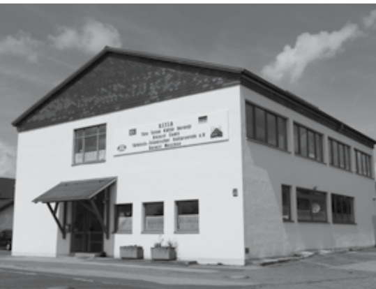
Die Korbacher Moschee in der Gabelsberger Straße

Es war nicht unser erster Besuch in der Korbacher Moschee. In jedem Jahr laden Muslime in Deutschland und so auch die Korbacher Moscheegemeinde bewusst am 3. Oktober, dem Tag der deutschen Einheit, zum Tag der offenen Moschee in ihre Gemeinderäume ein. Das ist ein deutliches Signal: Muslime sind Teil der deutschen Gesellschaft. Sie bereichern die religiöse Landschaft. Und sie gehören mit Christen und Juden zusammen zur Familie der abrahamitischen Religionen, also der Religionen, die Abraham als Stammvater des Glaubens ansehen. In einer Familie besucht man einander. Manchmal ist eine Familie sehr weit verzweigt, und die äußeren Spitzen sind weit voneinander entfernt. Da ist es gerade für die entfernte Verwandtschaft gut und wichtig, sich zu besuchen und ganz neu kennenzulernen, wie die anderen leben, wie sie eingerichtet sind, welche Atmosphäre ihr Zuhause atmet.