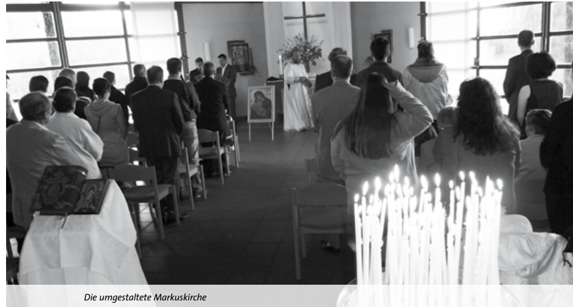
Die umgestaltete Markuskirche

Vespergottesdienst mit Brotsegnungsfeier zusammen